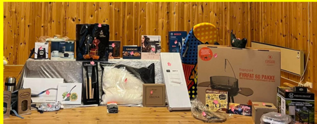
Bilde: Gevinstene fra påskebasaren 2024

Informasjon: Linn Irene Aarli, 473 70 843